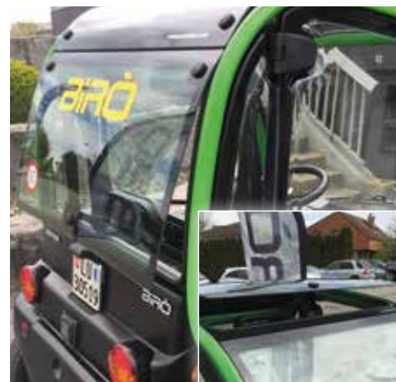
Ausstellbares Dach- und Heckfenster für optimale Belüftung (alle Varianten)