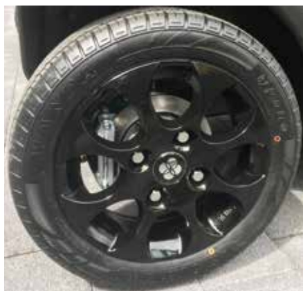
Leichtmetall-Felgen (Classic und Bolt)