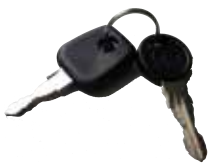
Konventionelles Schloss-System (Serie Biro Basic)