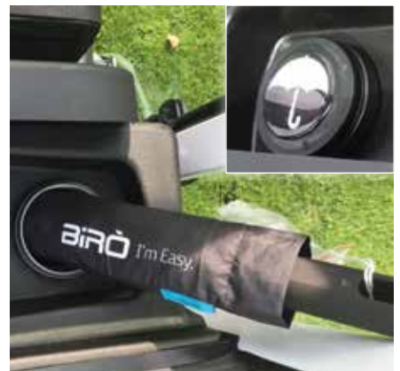
Schirmfach mit integriertem Birò Mini-Schirm (alle Standard - Varianten)