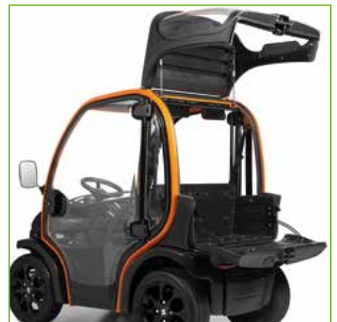
Ausstattungsvariante Big für zusätzlichen Stauraum (250 Liter) am Heck des Fahrzeuges. Transparenter, unzerbrechlicher Kunststoff