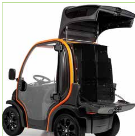
Ausstattungsvariante Box für zusätzlichen Stauraum (ca. 250 Liter) am Heck des Fahrzeuges. Schwarzer ABS Kunststoff, inkl. Befestigungsmaterial.