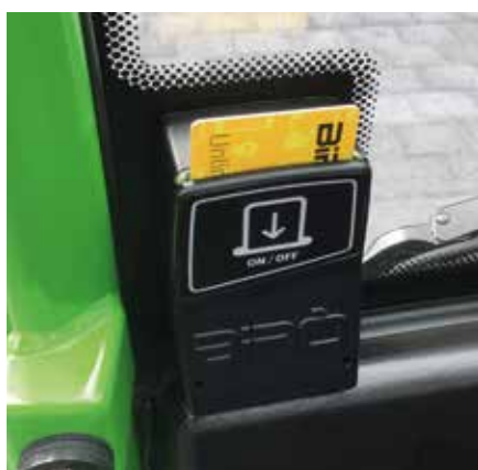
Zugangskontrolle mittels Magnetkarte (Classic und Bolt)