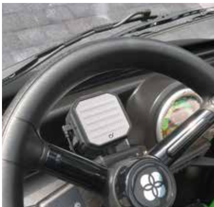
Bluetooth Lautsprecher (alle Varianten)