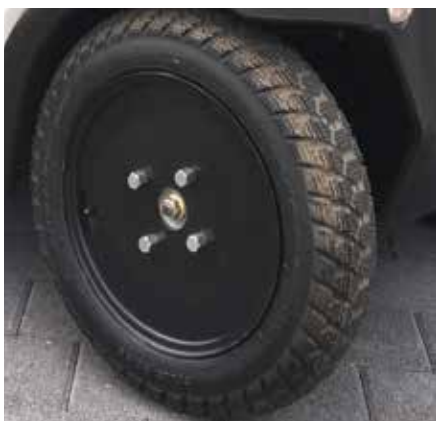
Stahlfelgen vorne und hinten (Biro Basic)